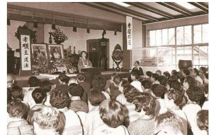
第1回 孝順の日(昭和54年6月10日)

*「讃檀」と印刷された多当に 支部・氏名・金額 をご記入のうえ、本堂ご宝前大三方へお納めください。